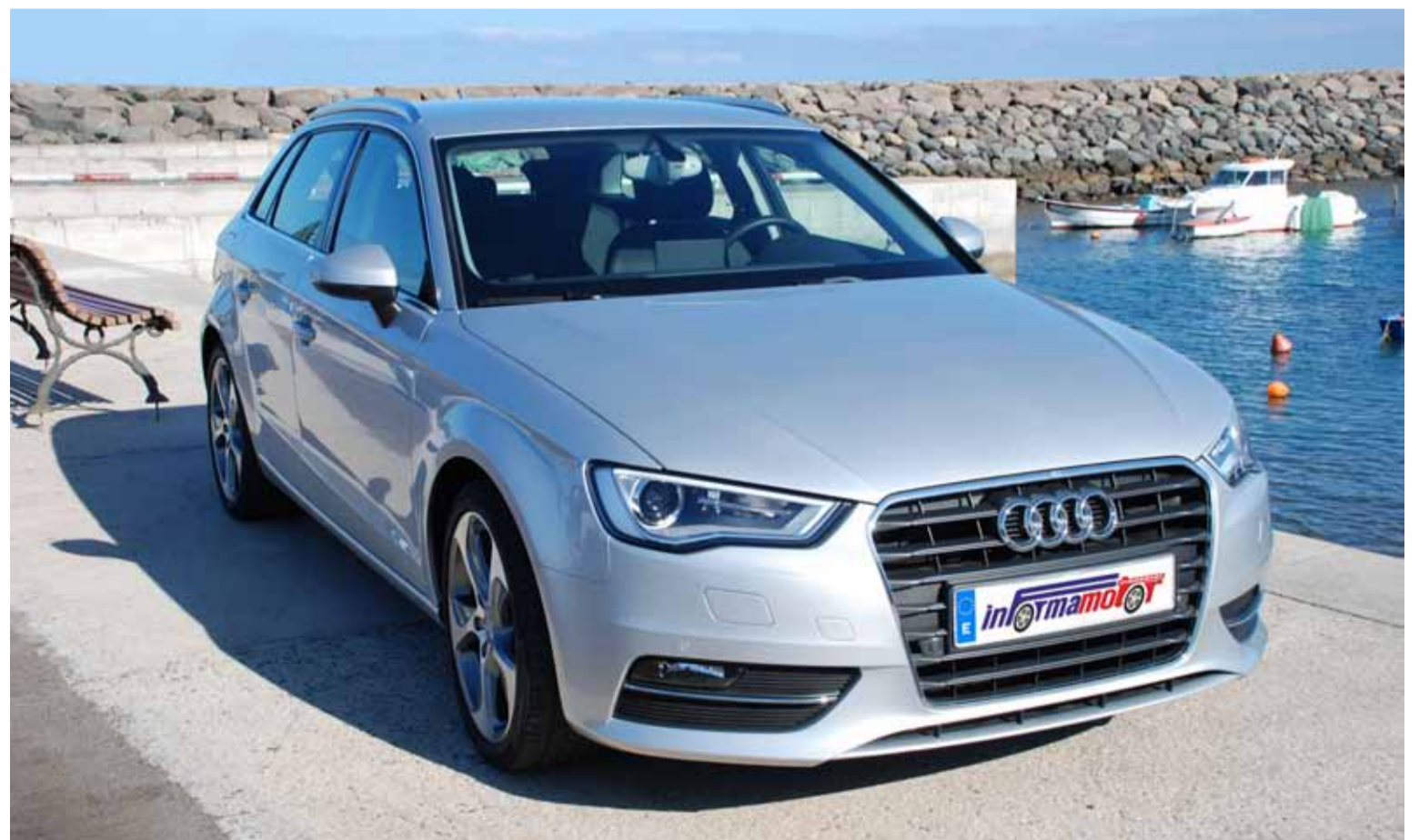
Gracias a la tecnología de construcción ligera Audi ultra, el peso se ha podido reducir hasta 90 Kg en comparación con el modelo anterior.