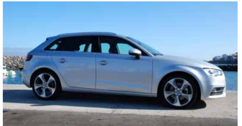
Con un generoso maletero de 380 a 1.220 litros.