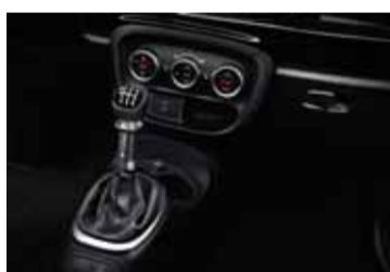
Cambio manual o Dualogic.