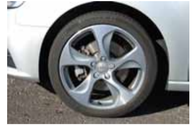
Llantas de 18".