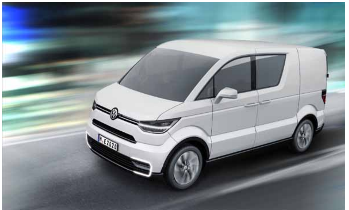
La altura del asiento del conductor es lo suficientemente elevada y confortable para ofrecer una excelente visibilidad.