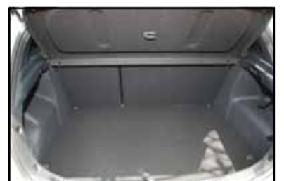
Un generoso maletero.