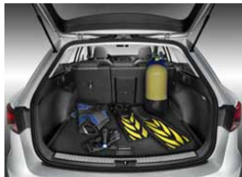
El maletero puede alcanzar los 1.470 litros.