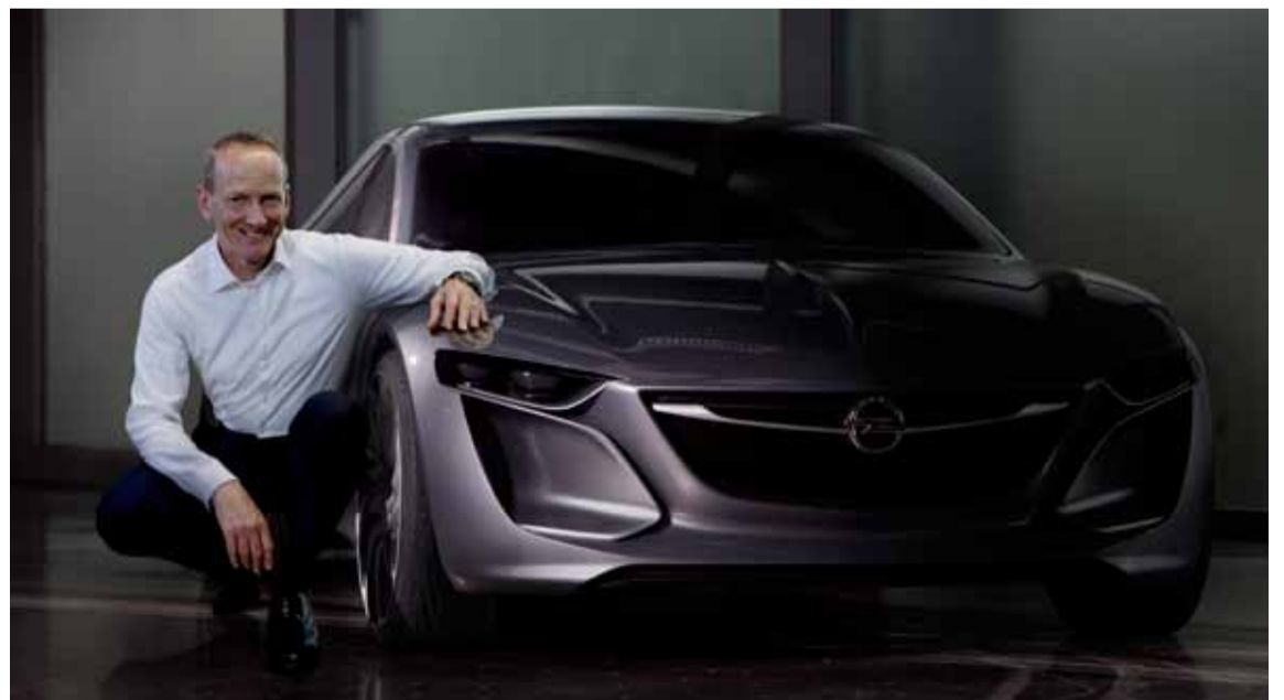
El avanzado Concepto Monza es el último de una saga de estudios visionarios que comenzó en 1965 con el Opel GT.