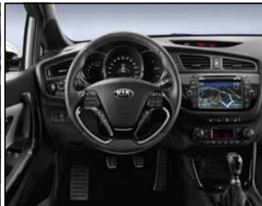
Puesto de conducción. Todo lo necesario y mucho más.