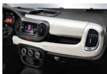
Consola con múltiples opciones.