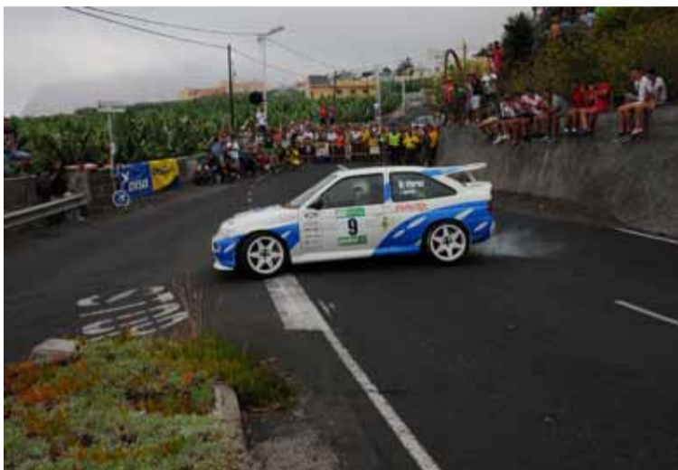
Nicomedes Perez primer palmero clasificado.

Texto: Redacción