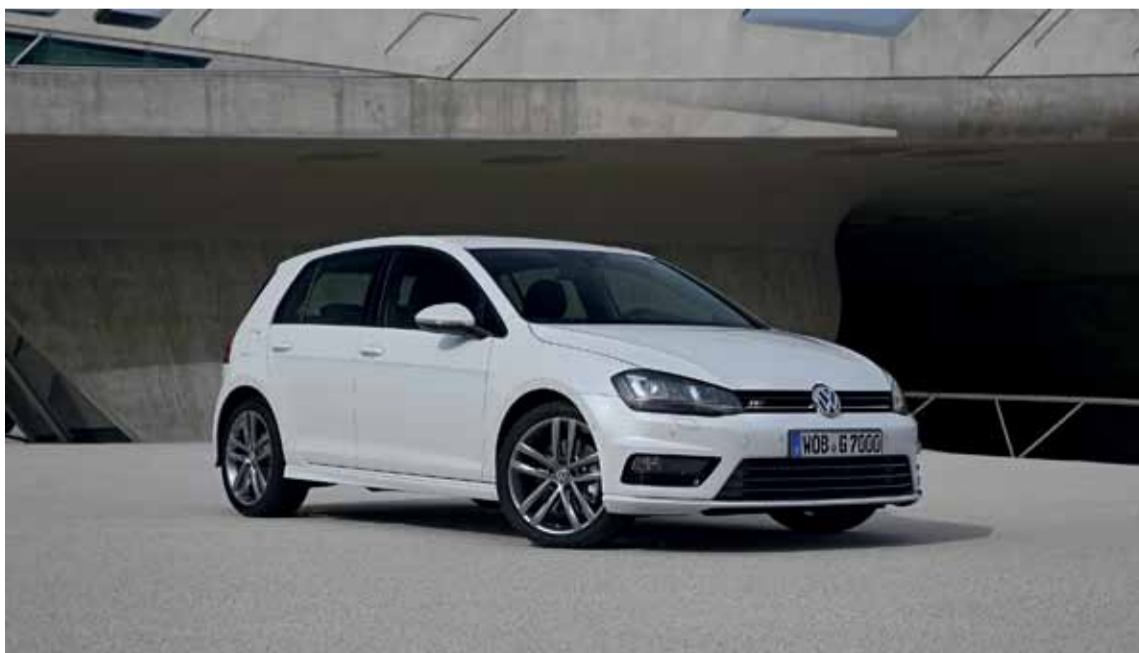
El Golf más innovador de todos los tiempos está disponible en Canarias desde tan solo 13.650 euros con plan PIVE incluido

Los paquetes R-line ofrecen como equipamiento opcional asientos deportivos R-line en tapicería de "Cuero Vienna" o diferentes diseños de llantas de aleación de 16, 17 o 18 pulgadas. Se equipan sobre el acabado Highline. Por 1.000€ el paquete Exterior y los paquetes Exterior e Interior por 2.200€.