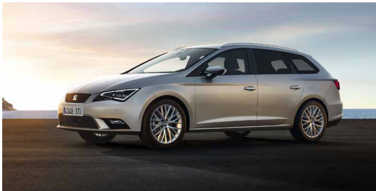
El controlador inteligente de velocidad ACC se puede emplear de manera indistinta con una caja de cambios manual o DSG.