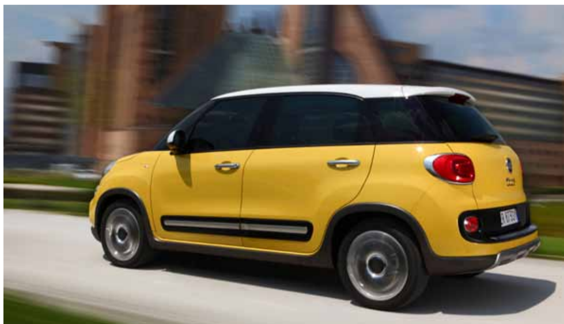
La familia del Fiat 500 ha crecido. Es capaz de satisfacer las necesidades del cliente más exigente.