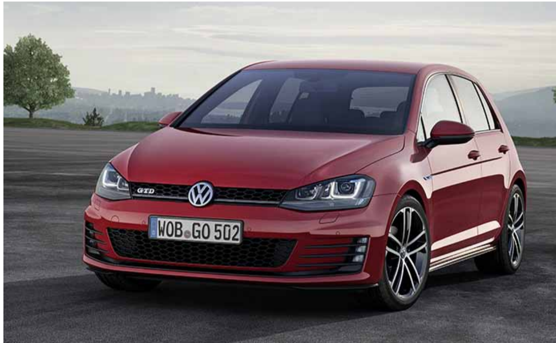
Con 79 CV más de potencia y 40 km/h más rápido de velocidad punta, pero que consume 0,3 litros menos de combustible

Ha sido a lo largo de los años la versión deportiva diesel de referencia del segmento y destaca por su asombrosa capacidad de aceleración. Con una potencia de 184 CV avanza hasta convertirse en el Golf turbodiesel más potente de todos los tiempos. Este "GTI entre los modelos diésel" está equipado con un motor TDI de cuatro cilindros de desarrollo completamente nuevo que le da alas y le permite alcanzar unas prestaciones deportivas extremas.