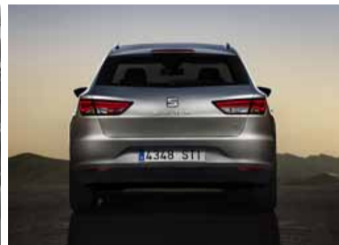
Elegante vista trasera del León ST.