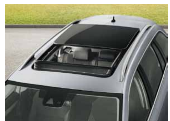
Detalle del techo solar practicable.