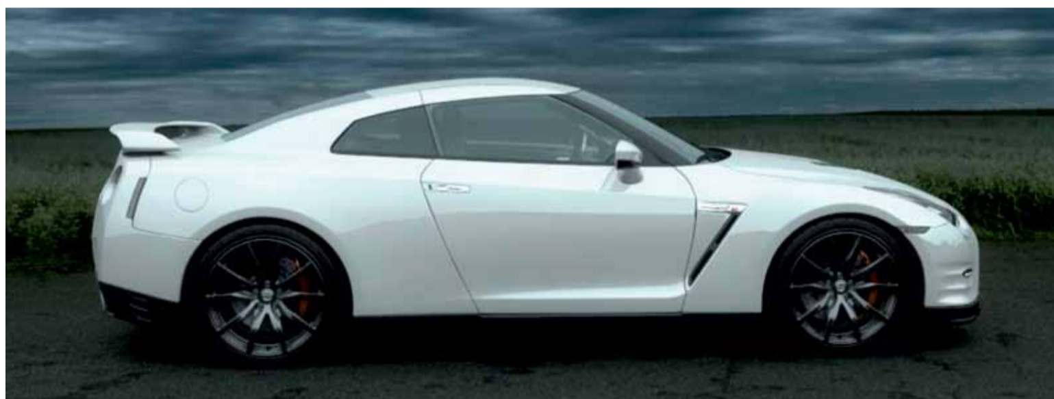
El Nissan GT-R 2013 es uno de los modelos más representativos y más evolucionados de la marca.