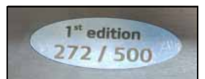
Número de serie de Edición Limitada