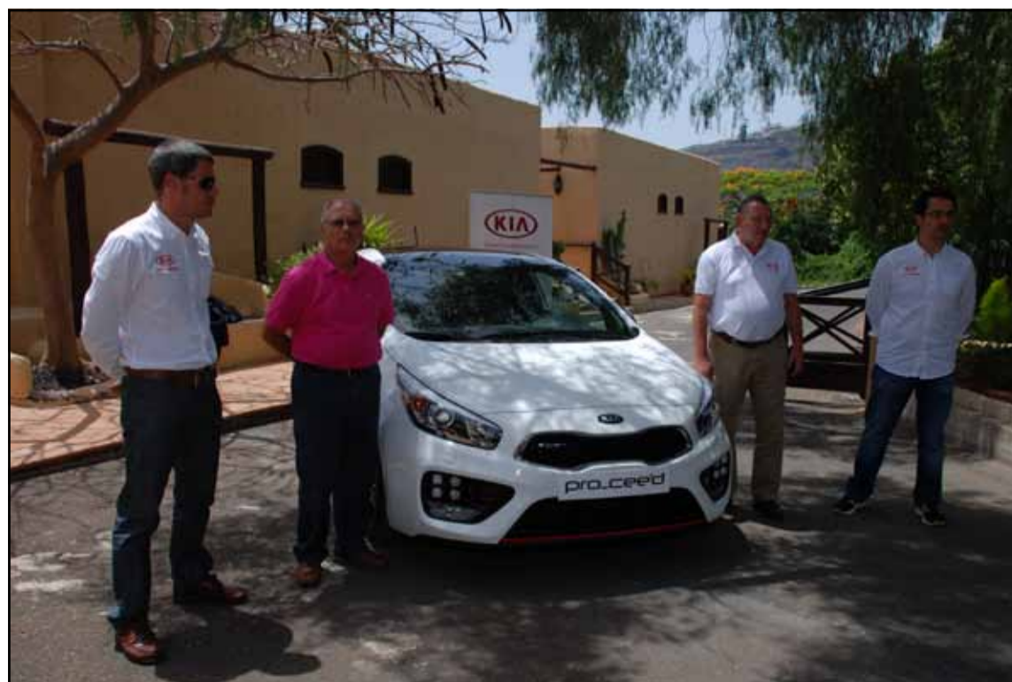
Foto oficial con los responsables de Kia en la presentación en Tenerife.