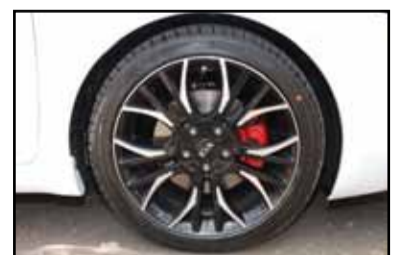
Llantas de 18"