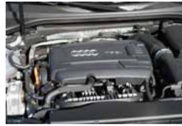
Motores potentes y eficientes.