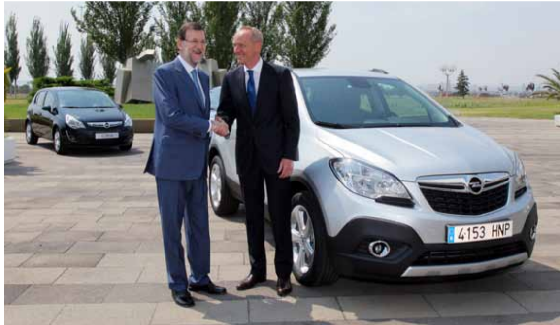
La alta demanda global del SUV ofrece oportunidades de capacidad adicionales.

Los grandes ganadores son los clientes y los empleados de Opel/Vauxhall en Europa, añadió Neumann: “Con esta inversión, seremos capaces de producir más Mokkas y atender más rápidamente a nuestros clientes.”