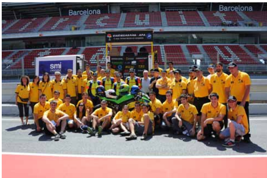
Castellarnau-APA. 11 Años formando técnicos en competición.