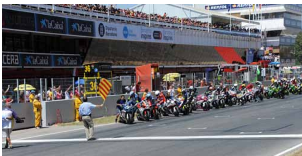
El momento siempre expectante de la salida tipo Le Mans