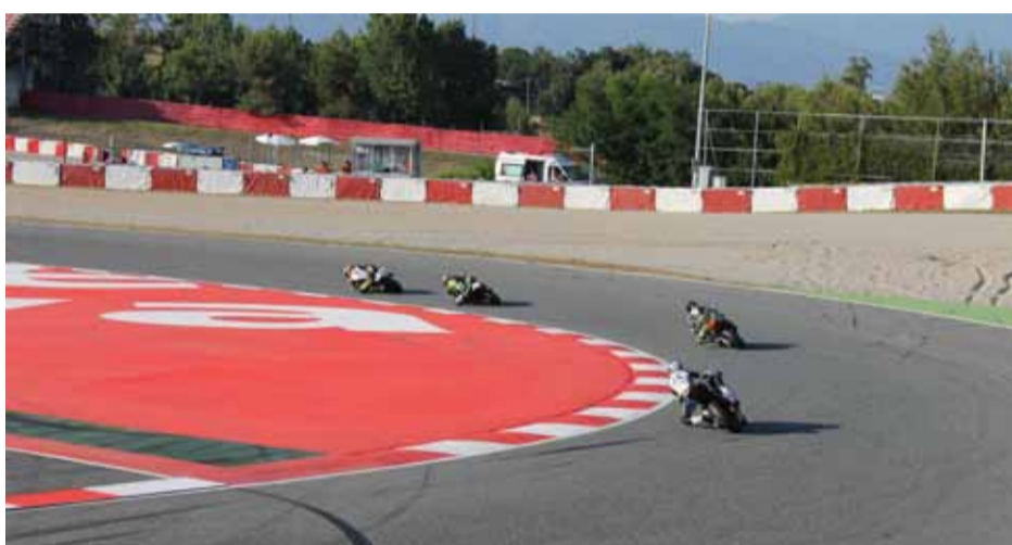
Varios participantes en la Curva la Caixa del Circuit.