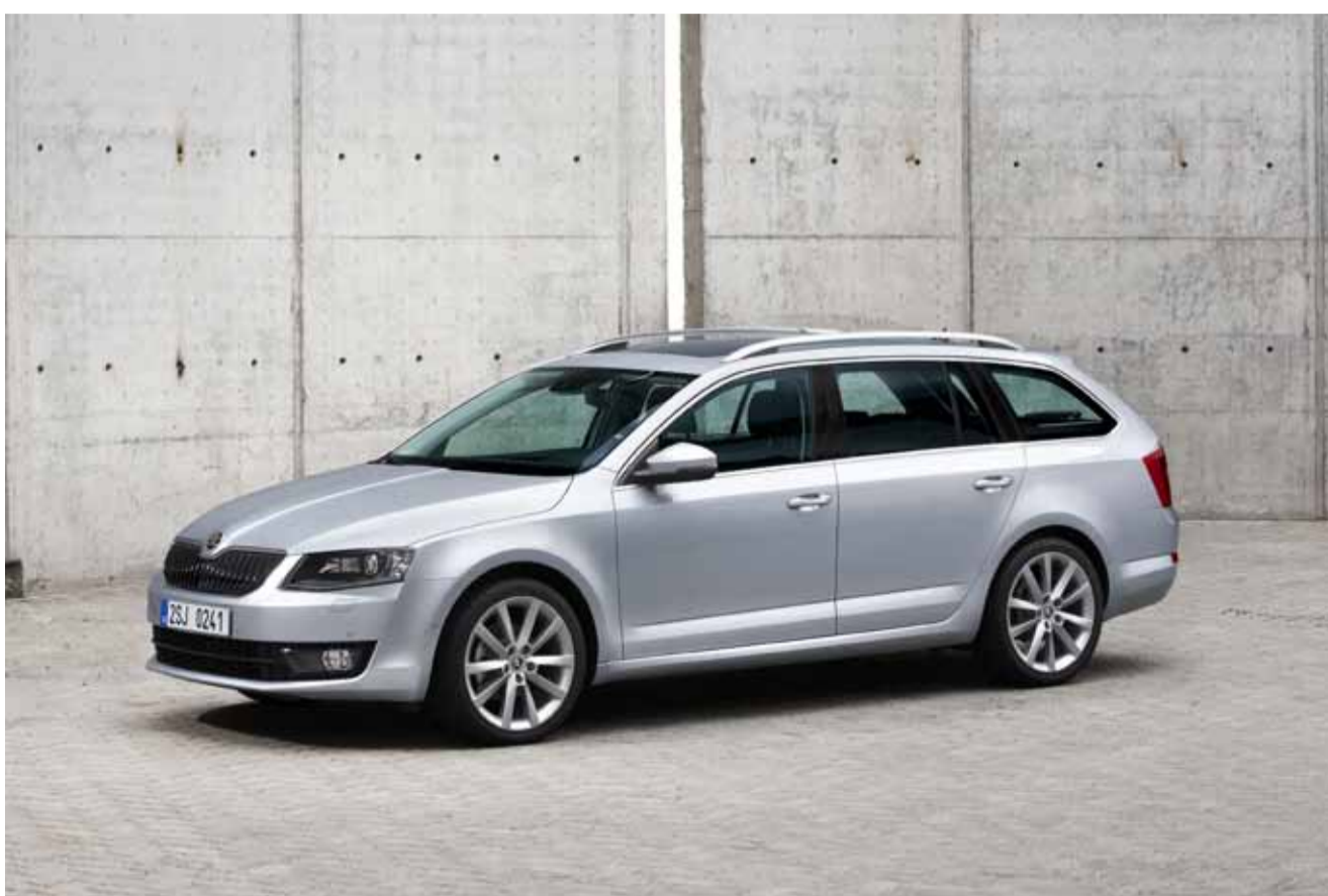
Con el lanzamiento del Octavia Combi y Combi 4x4, ŠKODA inicia la siguiente fase de la mayor ofensiva de modelos en su historia corporativa.