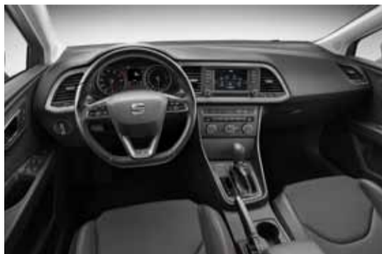
El interior no difiere del León de cinco puertas.