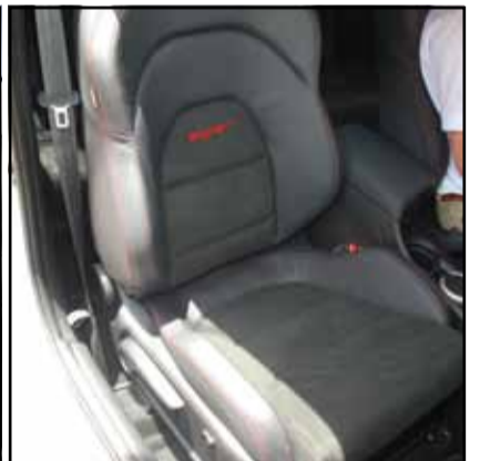
Ergonómicos asientos Recaro.