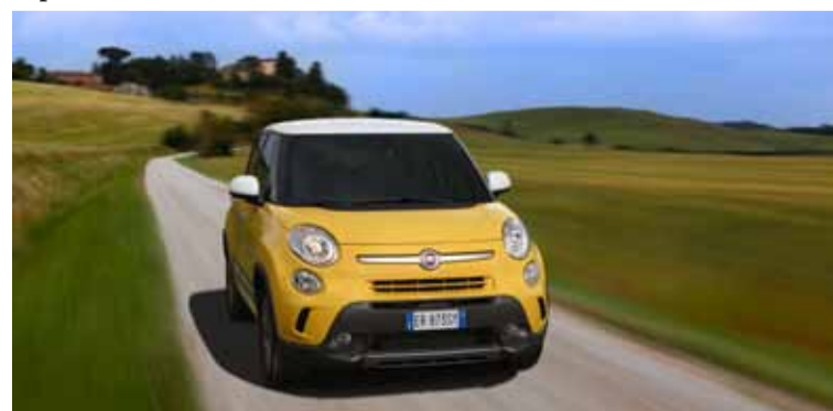
Es innegable la gran personalidad de un modelo aceptado mundialmente.