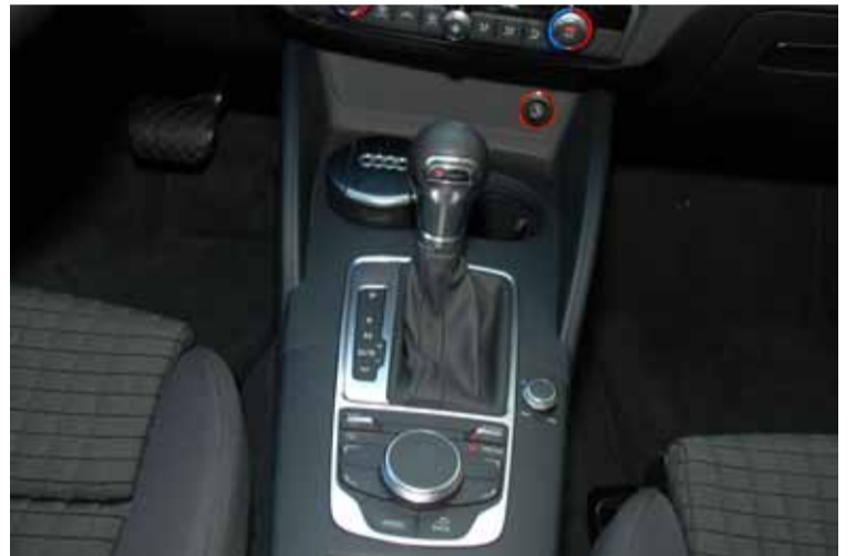
El cambio S Tronic de 7 relaciones es una maravilla técnica (el cambio del futuro).