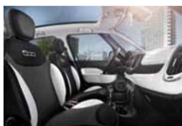
Un interior luminoso y bien acabado.