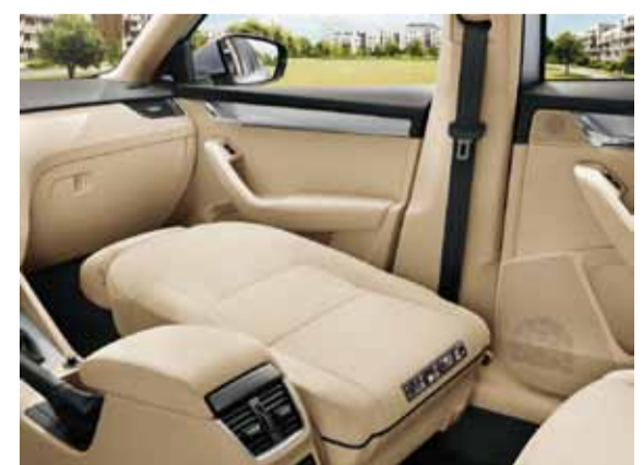
El volumen de carga puede llegar hasta los 1.740 litros.