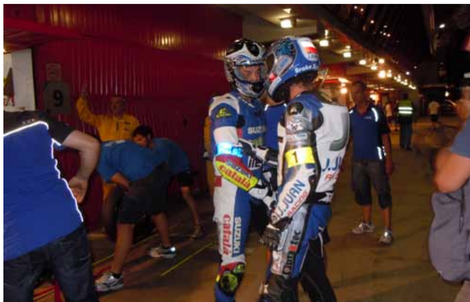
El cambio de impresiones entre los pilotos es importante en el momento del relevo.