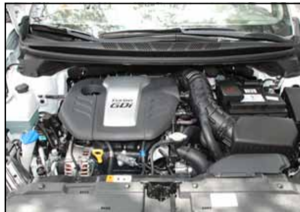
Un interesante abanico de motores donde elegir.