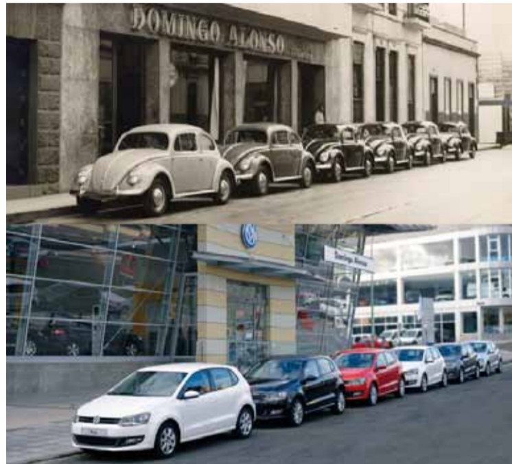
Ejemplo del éxito de la marca Volkswagen en Canarias, es su liderazgo en ventas durante más de ocho años consecutivos.