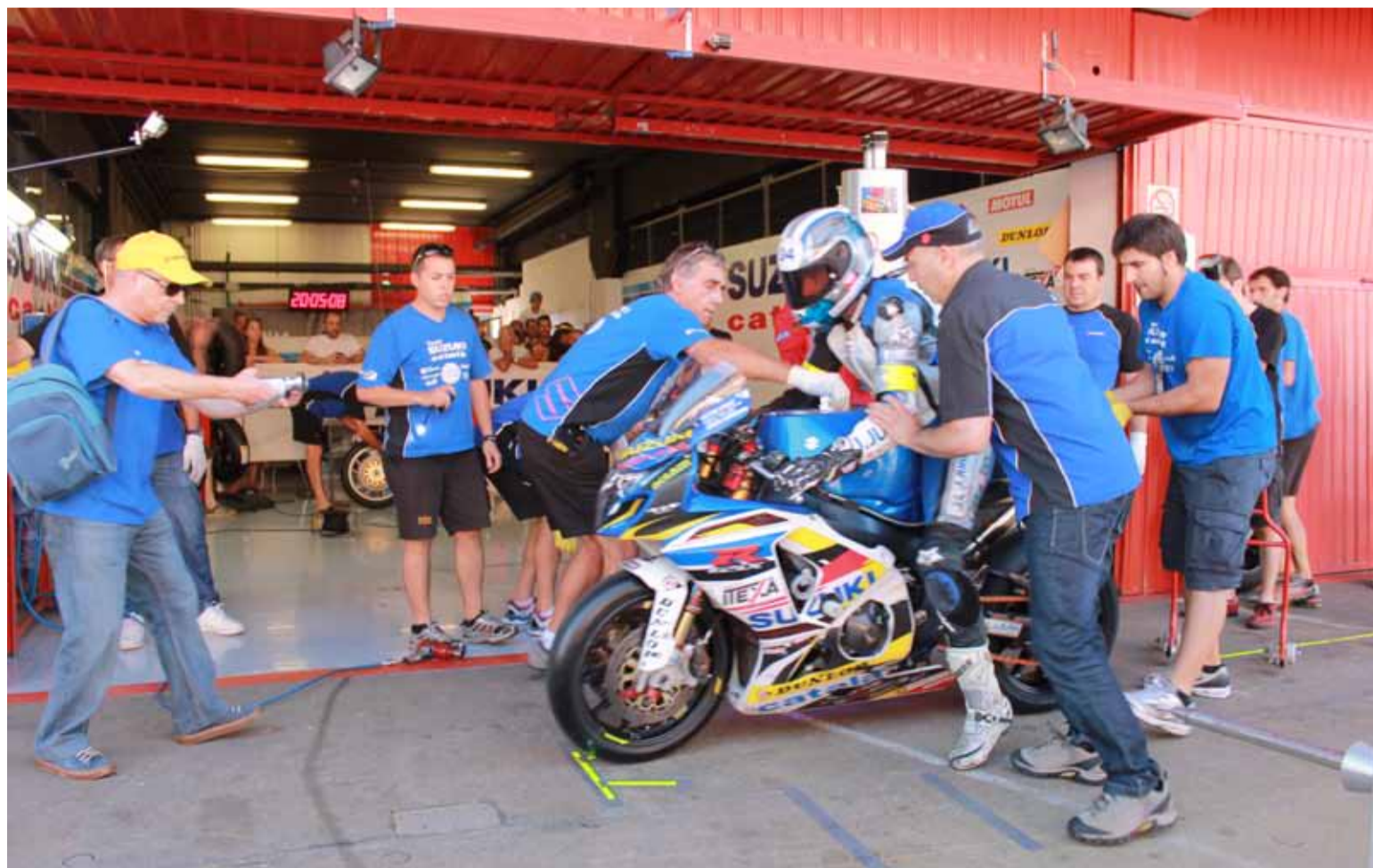
El momento de repostaje y cambio de piloto: tensión y espectacularidad.