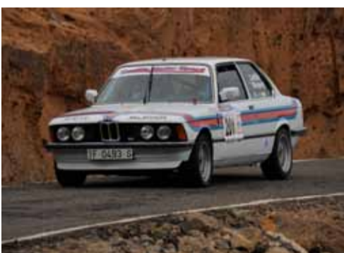
Pedro castilla-Jose marquez 3RS alta.