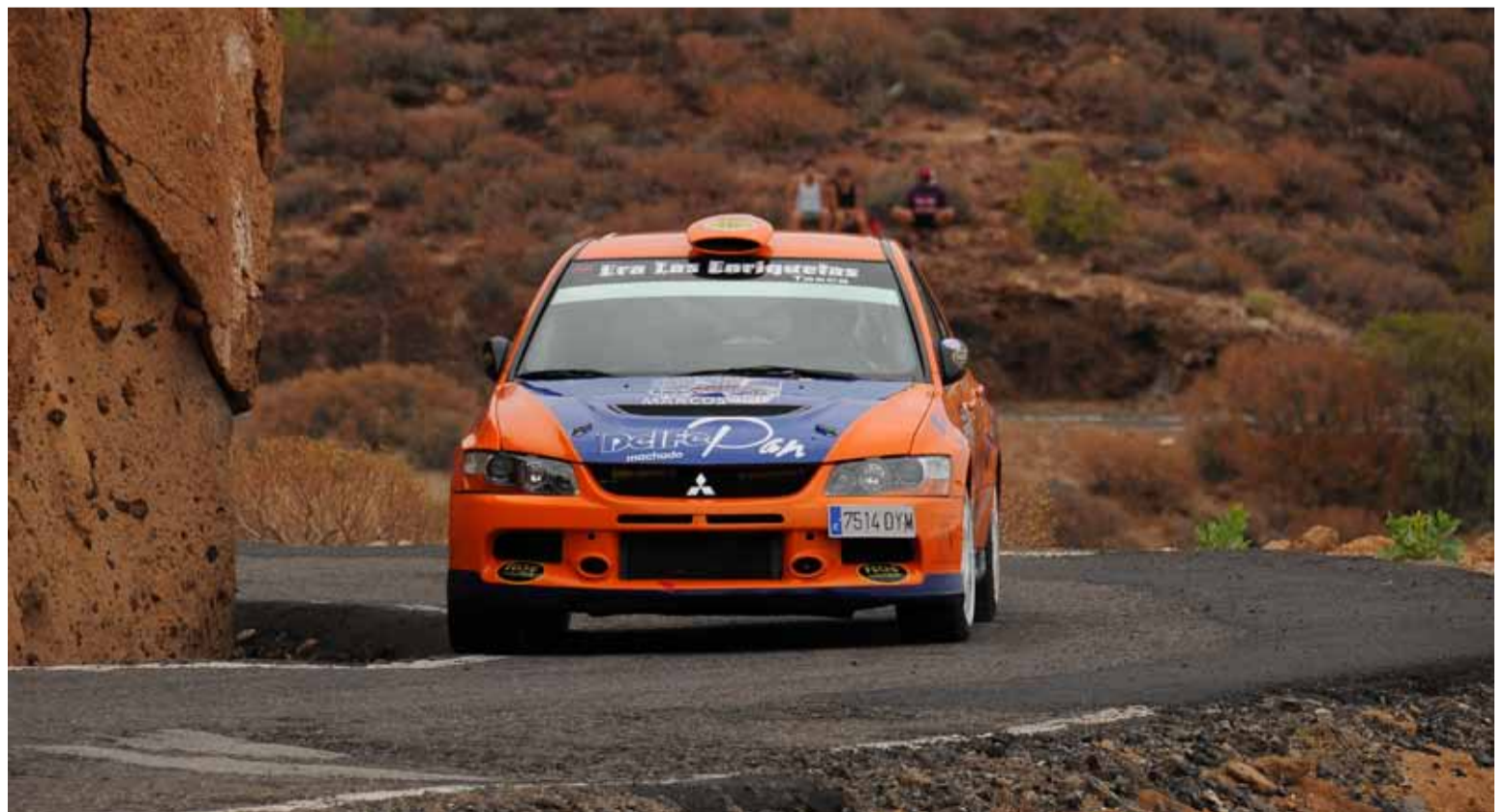
Víctor Delgado llevó su Mitsubishi a lo más alto del podio.