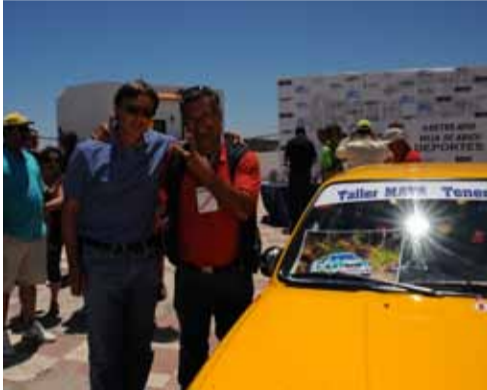
El veterano piloto grancanario amable como siempre.